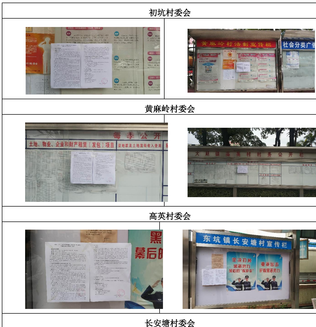
图 3.4-1 (c) 征求意见稿公示张贴照片