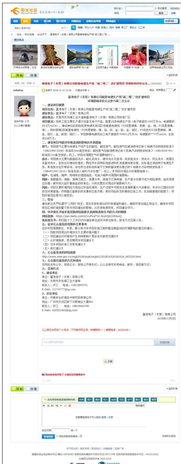
图 3.4-1 (a) 征求意见稿网上公示截图