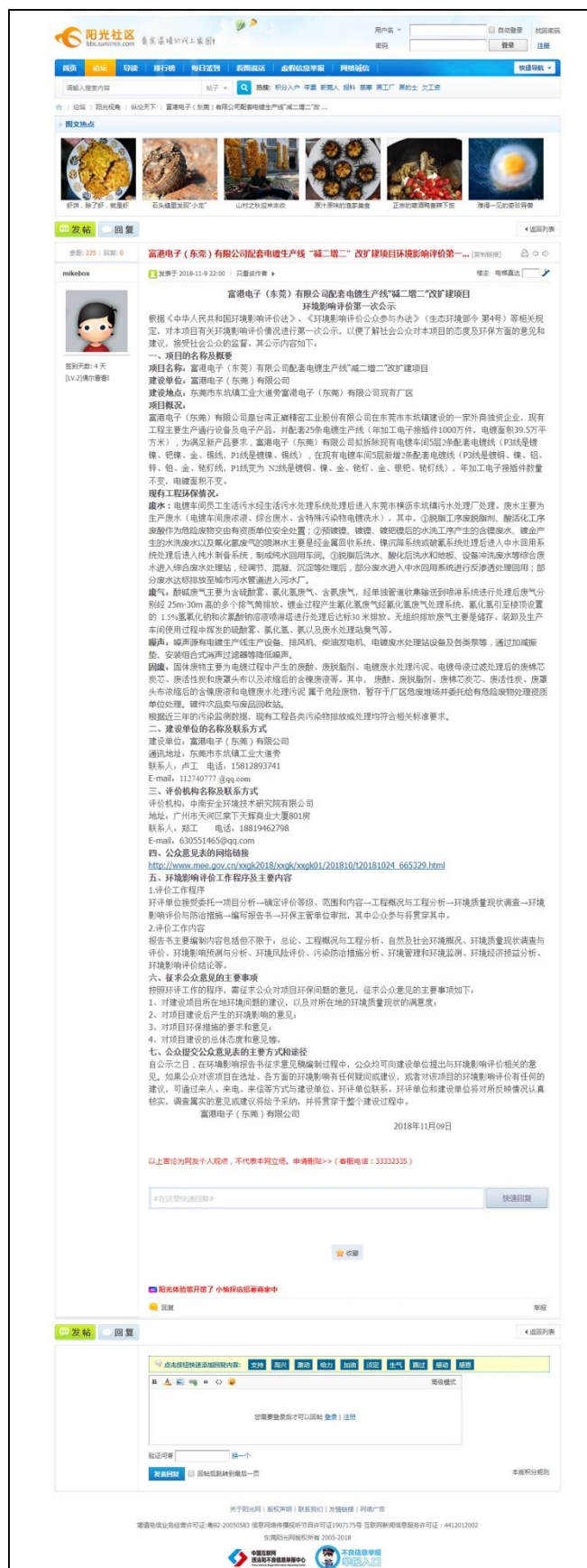
图 3.4-1 首次环境影响评价信息网上公开截图